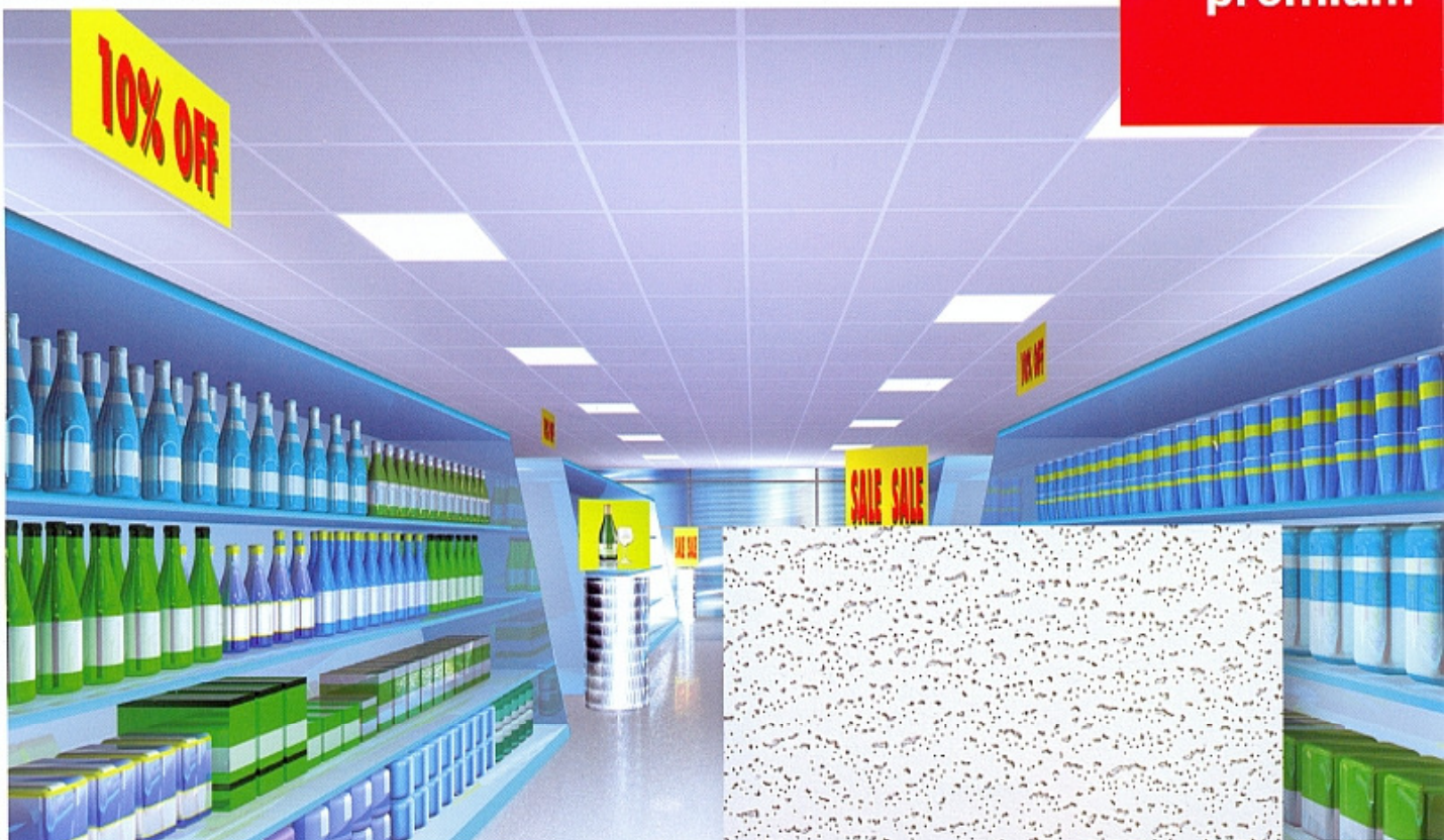
Povrchová úprava Harmony