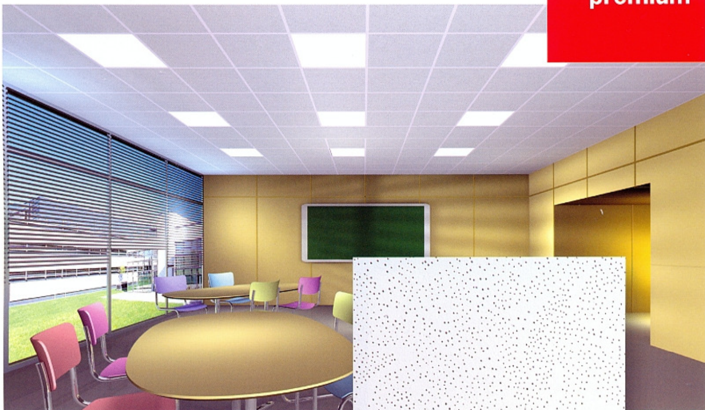
Povrchová úprava Sternbild (souhvězdí)