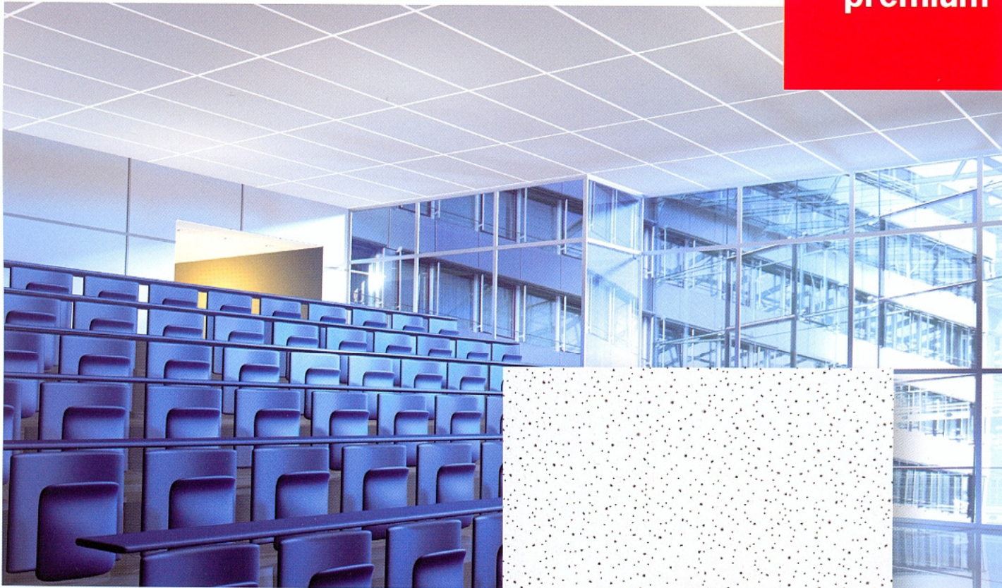
Povrchová úprava Finetta