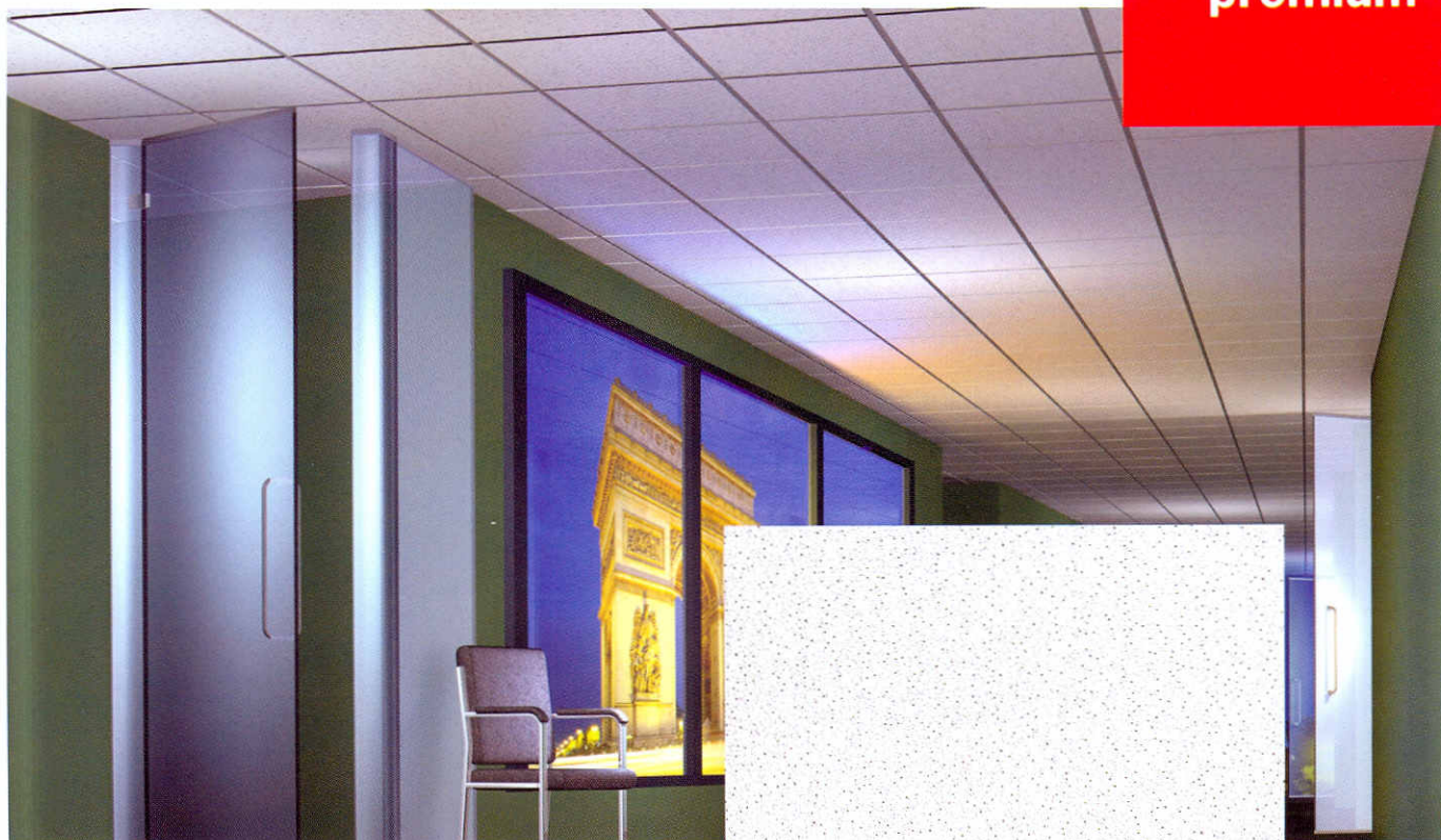
Povrchová úprava Sandila